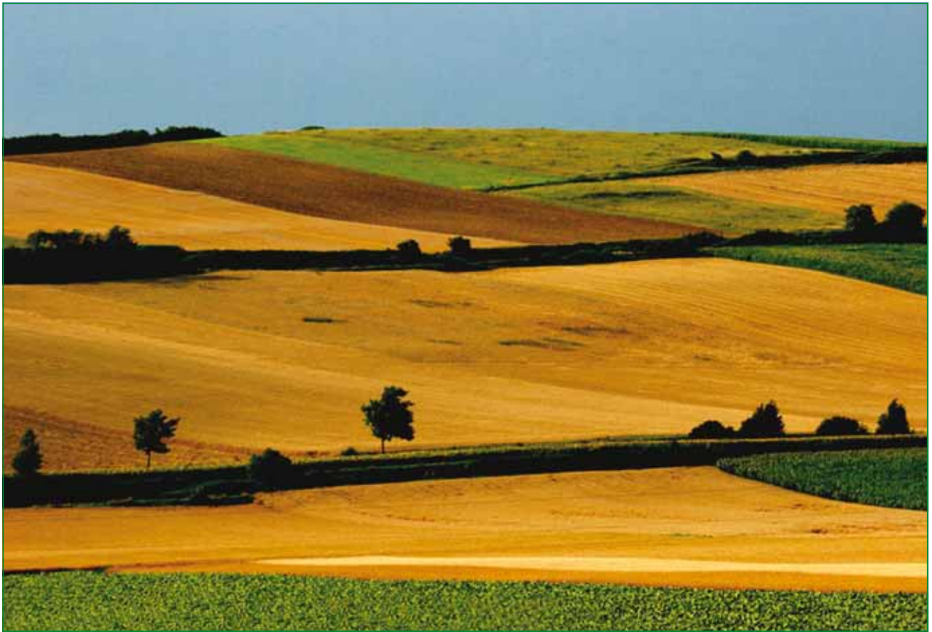
Abb. 3 Selenmangel in Deutschland

Immunfunktionen mit messbaren Effekten wie Anstieg der NK-Zellen sowie der reifen B-Lymphozyten. Es ist heute bekannt, dass Selen auf unterschiedliche Art und Weise entscheidend in das Immungeschehen eingreift. Dazu gehören Senkung der Expression der NF- \kappa B-Aktivität und signifikante Erhöhung der CD8 + -Lymphozyten, dass nicht nur die Bildung von Chemokinen, sondern die Expansion der verschiedenen Abwehrcellen beeinflusst.