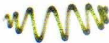
Abbildung 1: Aufnahme von Spirulina/Arthrospira platensis durch IGV Institut für Getreideverarbeitung, Nuthetal

In in-vitro-Untersuchungen wurden verschiedene Extrakte aus Spirulina/Arthrospira platensis auf ihre antivirale Aktivität hin untersucht. Es wurden unterschiedliche Extrakte von Arthrospira aus Myanmar (=Burma) mit solchen anderer Herkunft verglichen. Die Ergebnisse zeigen, dass Extrakte von Spirulina aus Myanmar (=Burma) einen zellulären Schutz von 80 bis 100 % gegenüber Herpes simplex Viren sowie von 75 bis 83 % gegenüber Influenza-Viren bieten.