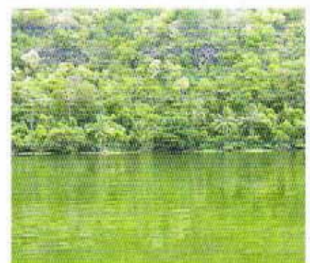
Abbildung 2: Kratersee in Myanmar (=Burma)

Die hier vorgestellten Daten sind das Ergebnis der Zusammenarbeit des IGV, Institut für Getreideverarbei-